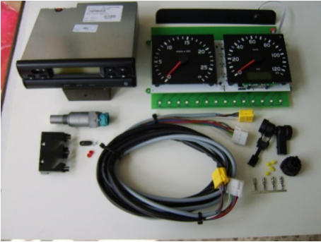
Art.-Nr. S00096 Volvo – Umrüstsatz mit Fahrtsschreibertyp 1324